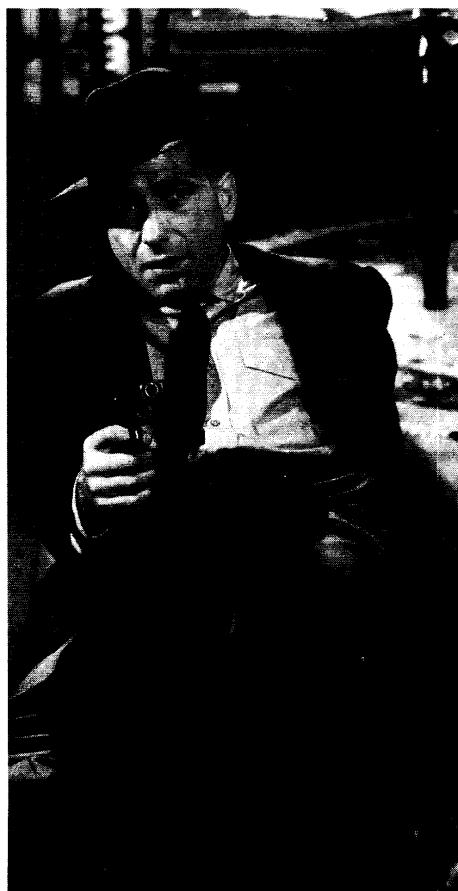
Bogart puso rostro de cine al género negro más clásico. Los Spade o Marlowe han encontrado herederos literarios de altura

Pues bien, para demostrar que la cosa no es tan fácil, aquí les dejo cinco títulos buenos de verdad, aunque no recomendables si lo que se quiere, en realidad, es dormir la siesta y utilizar el libro como arrullador: «Cuarenta maneras de decir dolor», de Giles Blunt (RBA); «Morituri», de Yasmina Khadra (Zoela); «Lugares sombríos», de Thomas H. Cook (Umbriel); «La colina de los suicidas», de James Ellroy (Punto de Lectura) y «1.280 almas», de Jim Thompson (Diagonal). Casi seguro que después de leerlos quedarán enganchados a la novela negra en todas las estaciones, y no sólo en verano.